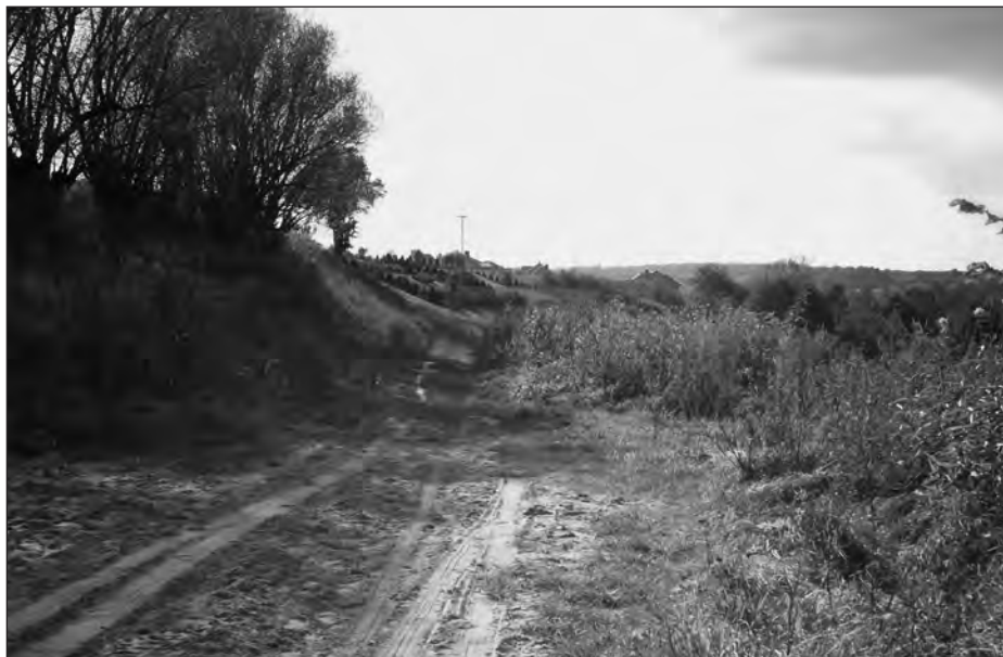
Droga w Dolinie Cybiny.

i zwierząt oraz ich zbiorowisk 8 . Stwierdzono występowanie aż 85 zbiorowisk roślinnych rozmieszczonych w dolinie mozaikowo. Z materiałów prof. dr hab. Ryszarda Gołdyna 9 przedstawionych na wspólnym posiedzeniu komisji Rady Miejskiej w Swarzędzu wynika, że w Dolinie Cybiny znajduje się 11 siedlisk chronionych, wśród których za najcenniejsze należy uznać suche śródlądowe murawy napiaskowe, lasy łęgowe i nadrzeczne zarośla wierzbowe oraz łęgowe lasy dębowo-wiązowo-jesionowe, niżowe i górskie łąki użytkowane ekstensywnie, starorzecza i inne naturalne eutroficzne zbiorniki wodne.