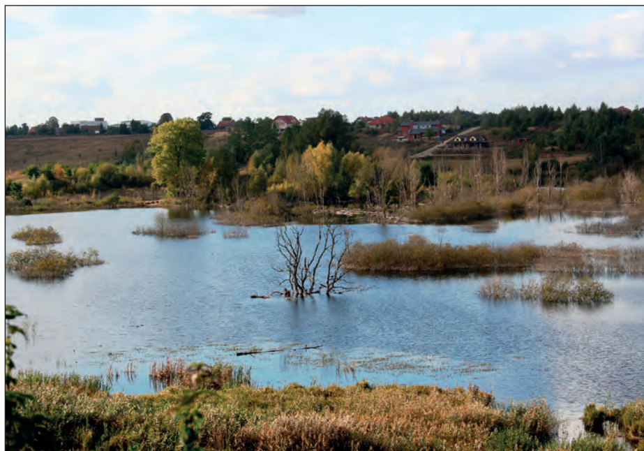
Rozlewisko w dolinie Cybiny.