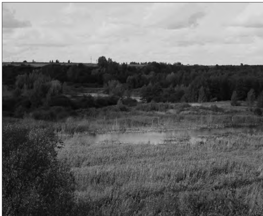
Rozlewiska w Dolinie Cybiny. Fot. Danuta Wereszczyńska-Choryńska

i dla specjalnych obszarów ochrony (SOO) 18 . Profesor R. Gołdyn w swoim wystąpieniu mówił, że objęcie Doliny Cybiny ochroną proponowano Ministerstwu Ochrony Środowiska już w 2000 r., następną była inicjatywa Polskiego Klubu Ekologicznego, który przedstawił proponowane przez siebie granice obszaru „Natura 2000” na powierzchni 1497,57 ha. Koncepcja przedstawiona przez prof. R. Gołdyna jest jej rozwinięciem na obszarze 2642,45 ha. Prof. R. Gołdyn przedstawił granice proponowanego obszaru ochrony oraz omówił zasady prowadzenia działalności gospodarczej na tym terenie. W dyskusji poruszono szereg wątków związanych z konsekwencjami podjęcia przez Radę Miejską uchwały akceptującej przedstawione przez prof. R. Gołdyna granice obszaru.