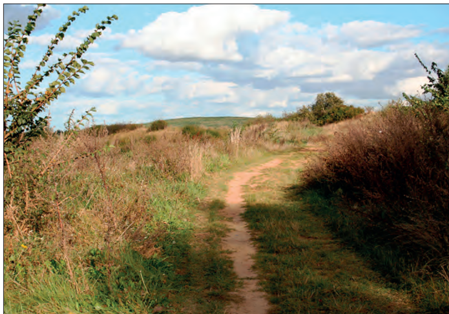
Dolina Cybiny.