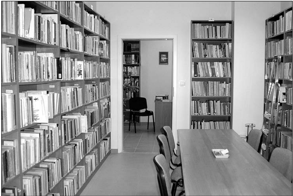
Biblioteka po przeprowadzce do nowego lokalu w 2008 r.